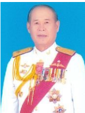
พลตรี จารึก อารีราชการณย์ กรรมการและที่ปรึกษา