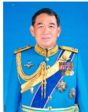
พลอากาศเอก ชนัท รัตนอุบล โฆษกคณะกรรมการ